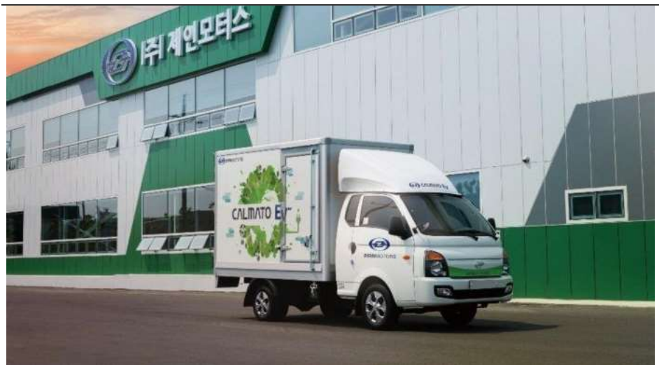
그림 1. 제인모터스(디아이씨 계열사)의 1톤 전기트럭

2019년 예상실적 대비(CB Dilution 고려) 현 주가 수준은 영업이익 기준으로는 밸류에이션 부담이 없고, 지배순이익 기준으로는 전기차관련 업체인 한온시스템, 우리산업 등과 비슷한 밸류에이션을 받고 있는 것으로 평가된다.